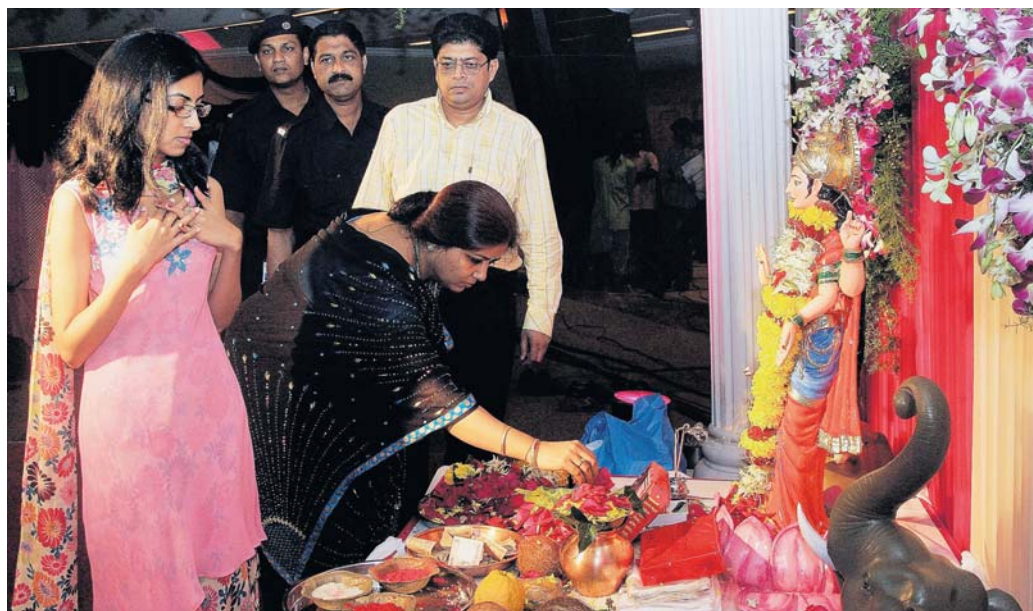
Pujas sind das wichtigste Ritual der Hindus - ob Geschäftsmann oder einfacher Bauer.